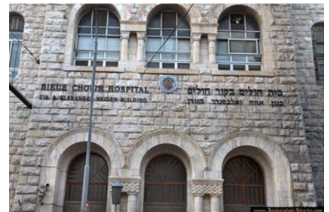
Ziekenhuis in Jeruzalem met een wel heel toepasselijke naam!

Ziekenbezoek is een van de mitswot waarvoor geen limiet is, je doet deze mitswa wanneer het nodig is en bent er dus nooit mee 'klaar'. Hoe vaker, hoe beter dus!