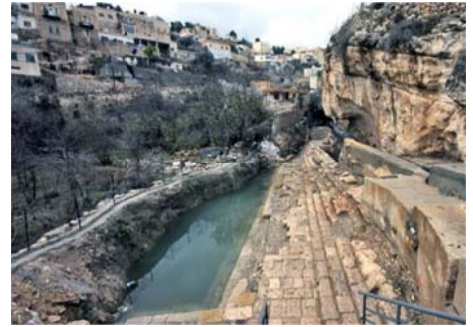
De waterbron van Sjiloach, bij Silwan

Tegelijkertijd werd in de tweede schaal wijn gegoten.